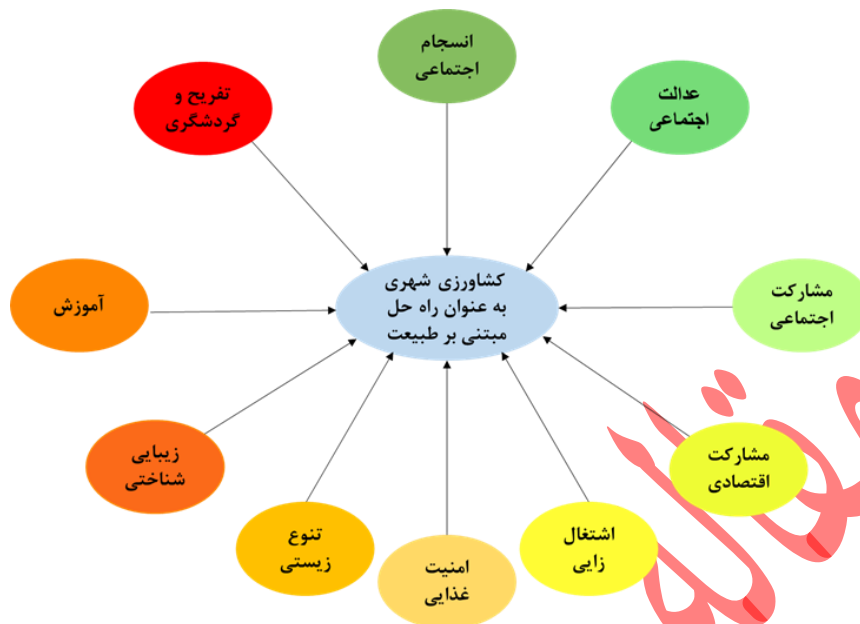
شکل ۱. شاخص‌های تاثیرگذار بر کشاورزی شهری