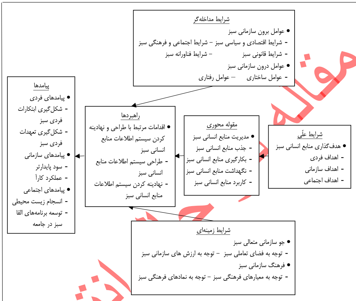
شکل ۱. نمودار پارادایمی کدگذاری محوری

کدگذاری محوری: بعد از کدگذاری باز، کدگذاری محوری صورت گرفت که در آن مقوله‌های متمایز از هم در چارچوبی معنادار کنار یکدیگر قرار گرفتند و روابط میان آن‌ها، به‌ویژه رابطه مقوله محوری با سایر مقوله‌ها، در قالب شکل ۱ مشخص شد. کدگذاری محوری در این پژوهش به صورت پارادایمی انجام پذیرفت.