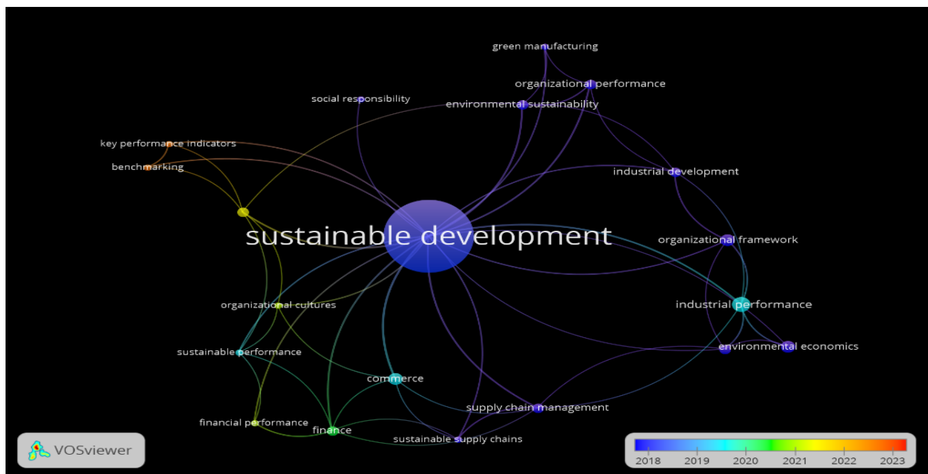
شکل ۳- نقشه هم‌رخدادی پر استنادترین کلمات کلیدی نمایه شده در گذر زمان

اطلاعات مربوط به ۵۳ مقاله مستخرج از اسکوپوس پس از قرار گرفتن در اکسل، وارد نرم‌افزار VOSviewer شد. مطابق با نظر پژوهشگر، از میان ۲۹۹ کلمه کلیدی نمایه شده، ۶۱ کلمه یافته شد که حداقل ۲ مرتبه در کنار یکدیگر در مقالات متفاوت مورد استفاده قرار گرفته بودند. پس از بررسی تک به تک کلمات و حذف کلمات غیر متناسب (مانند اسامی خاص، اسامی مناطق و کشورها و کلمات یکسان با نوشتارهای متفاوت) تعداد کلمات نهایی به ۲۰ عدد رسید و نقشه هم‌رخدادی پر استنادترین کلمات کلیدی نمایه شده رسم گردید.