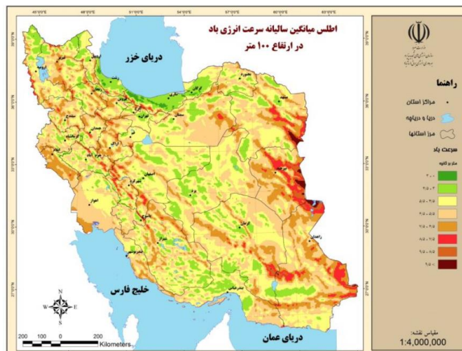
شکل ۱- میانگین سالانه سرعت باد

باد مربوط به تابستان است ۱ . این بادهای همواره در طول سال، تمام مناطق شمال استان سیستان و بلوچستان را تحت تأثیر خود قرار می‌دهد.