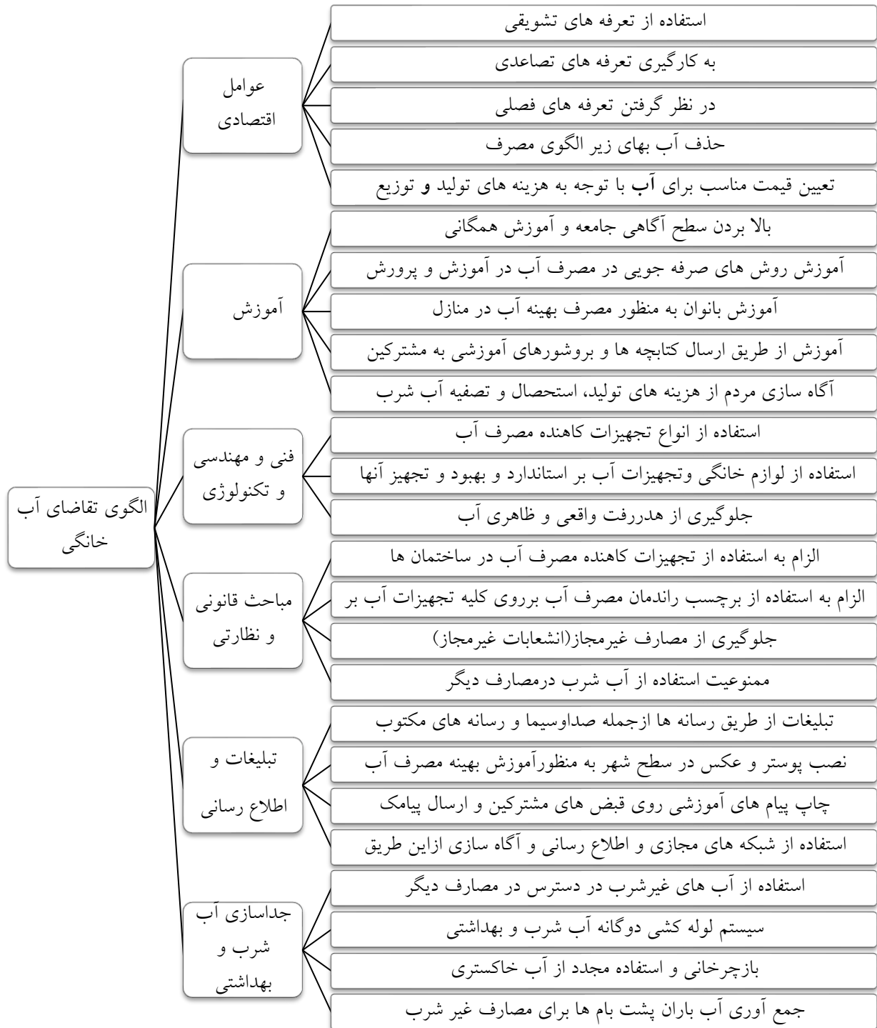
شکل ۲- درخت سلسله مراتبی، سطح اول: هدف، سطح دوم: معیارهای اصلی و سطح سوم: زیرمعیارها تعیین ضریب اهمیت معیارها و زیر معیارها

در شکل شماره (۲) مراحل انجام تحقیق به منظور رتبه بندی معیارهای موثر بر الگوی تقاضای آب خانگی نشان داده شده است.